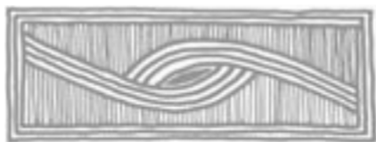
TABLE DE MATIÈRES